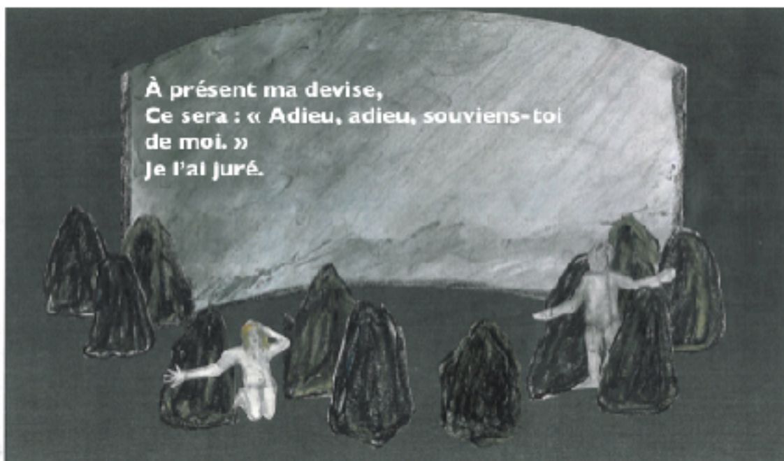
Croquis scénographique avec projection de la traduction

En fond de scène, sur un écran tendu sur un ou deux portants (en fonction des salles) concaves ou convexes de 3m de large, de 2,50m de hauteur pour l'un et de 2,90m pour l'autre. La traduction des monologues d'Hamlet sera projetée sur le décor lui-même, lorsqu'ils seront interprétés en anglais, le reste du texte restant en français.