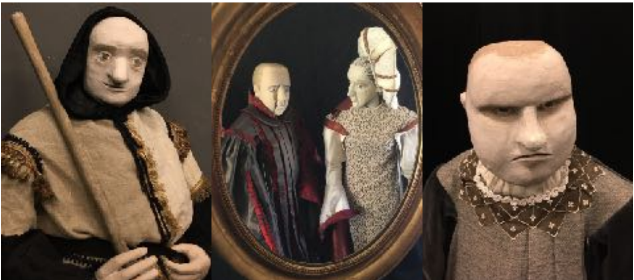
Le Fossoyeur - Le Roi Claudius - La Reine Gertrude - Rosencrantz

Trois marionnettes de petite taille, comme des jouets d'enfance, joueront dans un castelet la scène dite de « la souricière ».