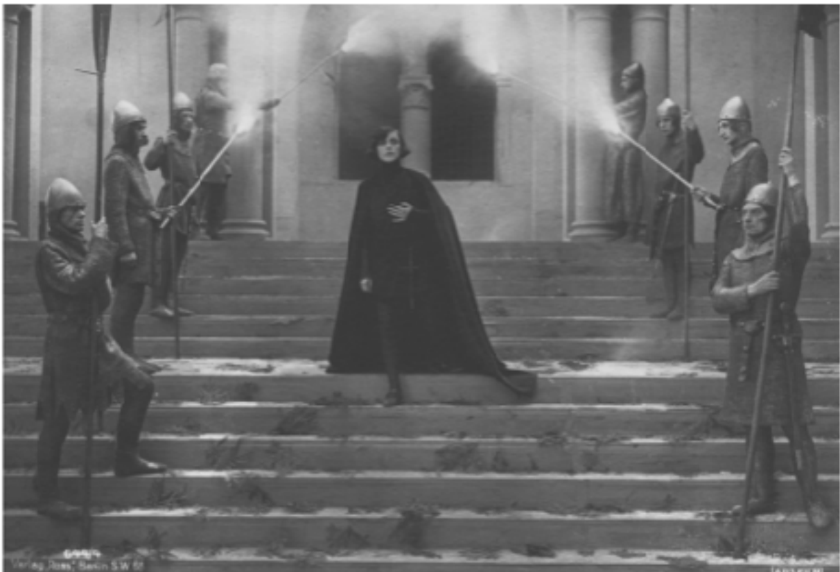
« Asta Nielsen : Hamlet descend les escaliers à Elseneur » Hamlet , Allemagne, 1920