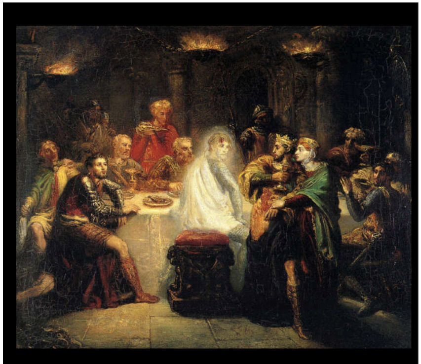
Théodore Chassériau - 1819-1856 Le spectre de Banquo s'invite à dîner dans Macbeth de Shakespeare (acte III - scène 4)