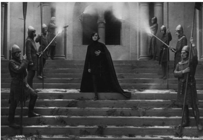
« Asta Nielsen : Hamlet descend les escaliers à Elsenour » Hamlet , Allemagne, 1920